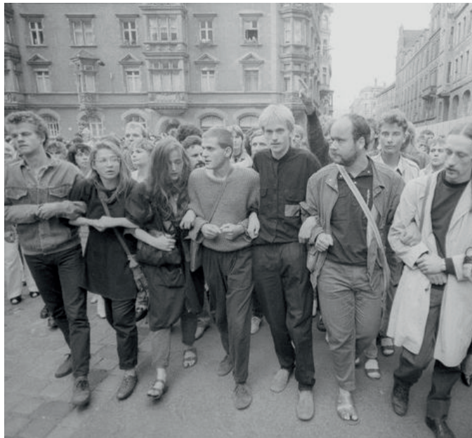
Demonstration am 4. November 1989 auf dem Alexanderplatz in Berlin.

In kritischer Befragung unseres Umgangs mit deutscher Geschichte und ihrer Vermittlung soll es im Gespräch mit den eingeladenen europäischen Partner*innen um unseren Beitrag zu einer europäischen Erinnerungskultur gehen. Denn diese im Dialog zu entfalten wird eine Aufgabe der Gegenwart und Zukunft sein, soll das Projekt Europa politisch nicht auseinanderfallen. Die Veranstaltung soll dazu Denkanstöße liefern.