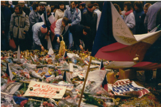
Auf dem Wenzelsplatz in Prag im November 1989

Die letzte Europawahl hat mindestens zwei unterschiedliche gesellschaftliche Strömungen in Europa zum Ausdruck gebracht: Einerseits ist der Wille diesen Kontinent zu stärken und demokratisch zu entwickeln ausgeprägt, andererseits haben sich nationalistische, illiberale und rechtsextreme Kräfte mit erheblicher Zustimmung zum Angriff auf europäische Errungenschaften formieren können. Diese in allen europäischen Ländern wirksamen Kräfte bedienen sich in ihrer Propaganda nationalistisch geprägter Geschichtsbilder, die Rassismus, Autoritarismus, innere und äußere Abgrenzungen gegen das Andere, auch Antisemitismus als Selbstverständlichkeit nationaler Eigenart begründen sollen. Reale kulturelle Verankerungen in einer europäischen und globalen Welt bilden dabei den Resonanzraum von Abschottungs- und Ausgrenzungspolitik.