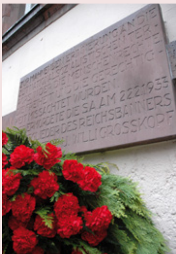
Gedenktafel am Lister Turm.

Stadtteilzentrum Lister Turm und Förderverein Lister Turm; Kontakt: Tel. 0511-16843095; Email: Birgit.Ahrens@Hannover-stadt.de