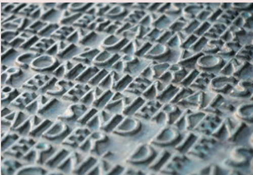
Gedenkstein für das KZ Conti-Limmer

Arbeitskreis „Ein Mahnmal für das Frauen-KZ in Limmer“ ( www.kz-limmer.de )