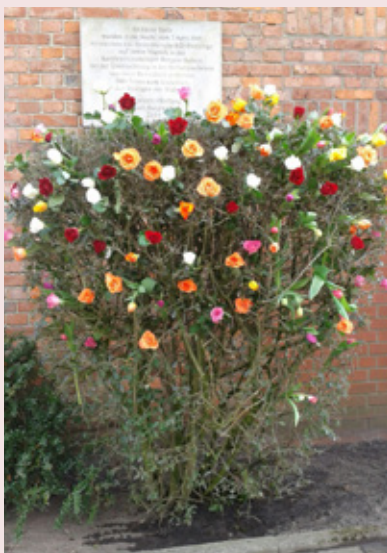
Gedenktafel und bunter Strauch an der Scheune, Foto: Rudi Gutte

Bürgerinitiative „Gegen das Ver- gessen“ Burgwedel