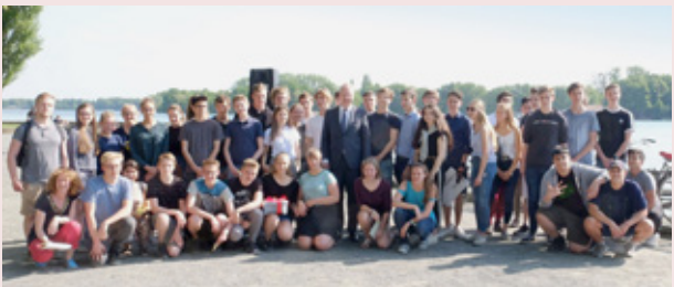
Schülerinnen und Schüler der Tellkampfschule im Mai 2018.

Landeshauptstadt Hannover – ZeitZentrum Zivilcourage in Kooperation mit der Tellkampfschule Hannover