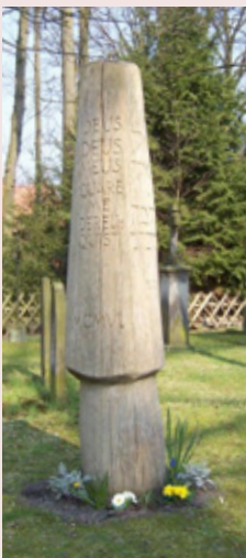
Stele an der L.-Harms-Kirche in Fuhrberg; Foto: W. Schwenger

Natürlich ist es auch möglich, nur einzelne Teilstrecken mitzugehen.