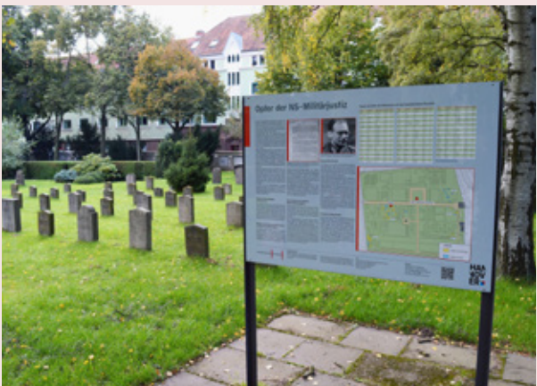
Gedenktafel für die „Opfer der NS-Militärjustiz“ auf dem Fössefeldfriedhof Hannover Linden

Netzwerk Erinnerung und Zukunft in der Region Hannover in Kooperation mit der Region Hannover, der Landeshauptstadt Hannover, der Stiftung niedersächsische Gedenkstätten, der Klosterkammer Hannover, dem ver.di Bildungswerk Hannover und dem Volksbund Deutsche Kriegsgräberfürsorge.