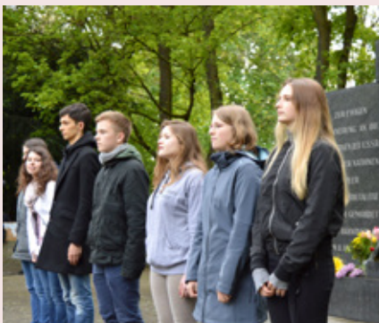
„Ich erinnere mich!“ – Jugendliche im Mai 2017

Landeshauptstadt Hannover – ZeitZentrum Zivilcourage in Kooperation mit der IG Metall, dem Volksbund Deutsche Kriegsgräberfürsorge und der Maschsee-AG