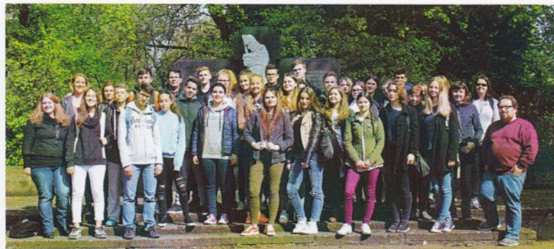
Teilnehmer*innen der Internationalen Jugendbegegnung Hannover, 2017