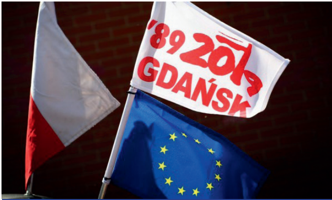
Mit Demonstrationen der Gewerkschaft »Solidarność« in Danzig begann die friedliche Revolution in Europa. Deutschlandfunkkultur v. 28.8.2019